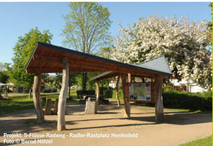
Projekt: 5-Flüsse-Radweg - Radler-Rastplatz Henfenfeld

Das Beitrittsformular finden Sie zum Download auf unserer Homepage: lag.nuernberger-land.de