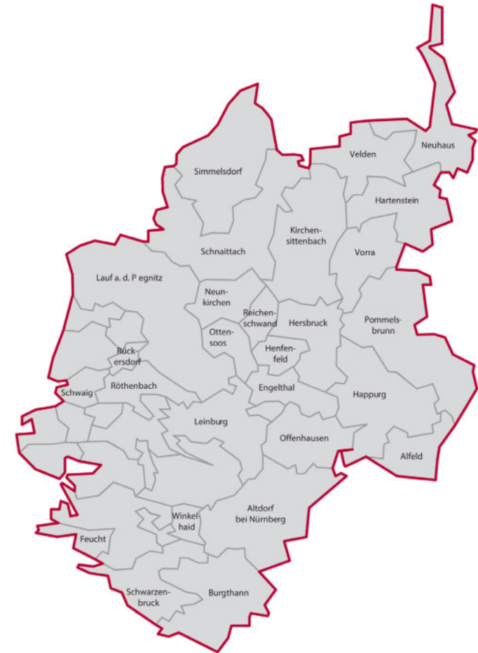
Die LAG Nürnberger Land e. V. umfasst den gesamten Landkreis Nürnberger Land.