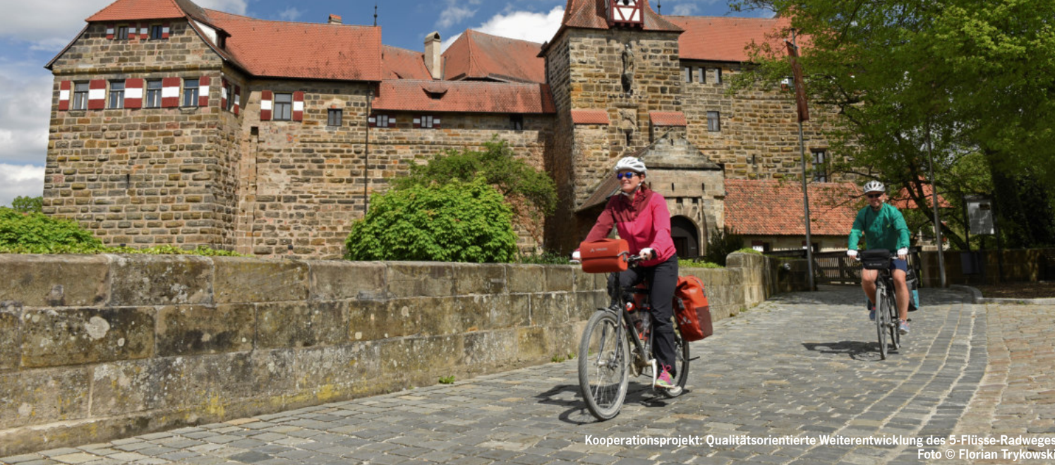
Kooperationsprojekt: Qualitätsorientierte Weiterentwicklung des 5-Flüsse-Radweges