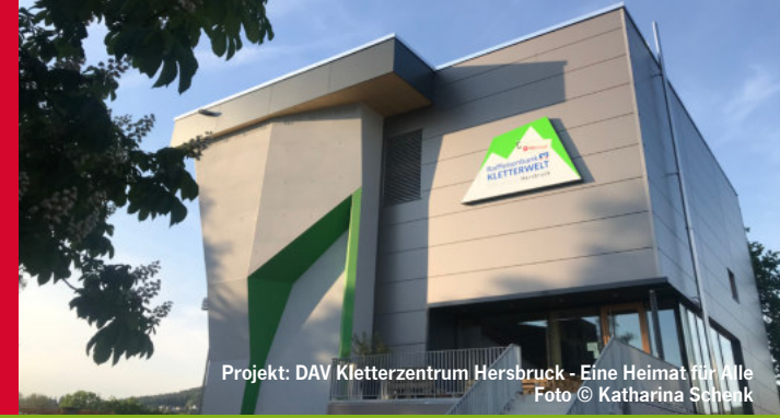
Projekt: DAV Kletterzentrum Hersbruck - Eine Heimat für Alle